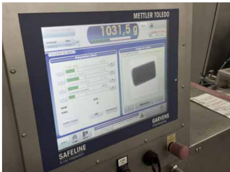
A kombinált rendszer szoftveres kezelőfelületén a tömegmérés és a röntgenes vizsgálat eredménye egyaránt megtekinthető.

A dinamikus ellenőrzőmérlegek biztosítják, hogy minden termék mérlegelése a késztermékekre vonatkozó európai előírásoknak megfelelően történjen. A szennyezett termékekhez hasonlóan, a nem megfelelő súlyú, alultöltött termékeket a rendszer azonnal selejтеzi. A gyártósorokon különböző tartalmú és csomagolású termékek készülnek. A termékvizsgáló berendezés különösen intuitív szoftveres kezelőfelületének és nagy termékprogrammemóriájának köszönhetően a különböző termékek közötti váltás gyakorlatilag egyetlen pillanat alatt elvégezhető. Ennek és a számos egyéb hasznos funkciónak köszönhetően a kezelő értékes időt takaríthat meg és nő a csomagoló gyártósorok