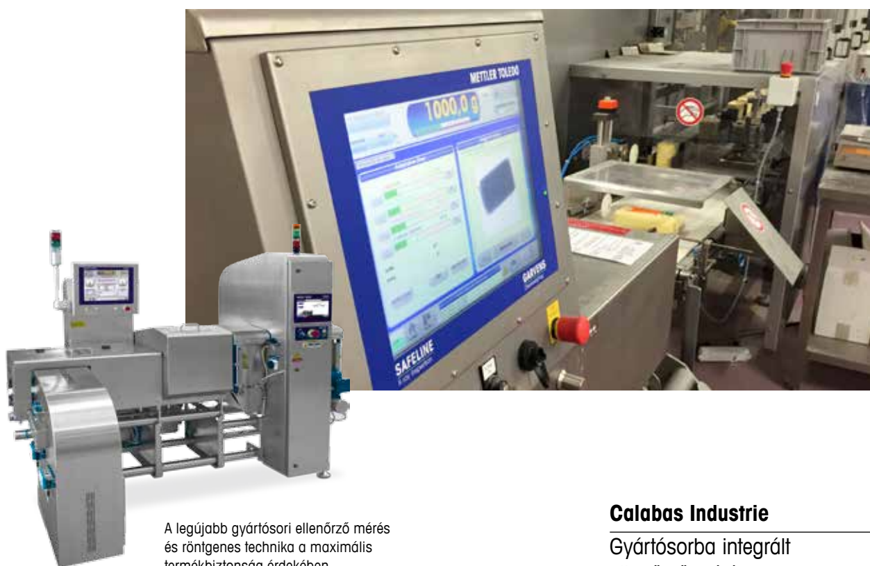
A legújabb gyártósori ellenőrző mérés és röntgenes technika a maximális termékbiztonság érdekében

A szárított gyümölcsök és zöldségek szállítmányozására, raktározására és megbízásos csomagolására specializálódott francia cég, a Calabas Industrie, 2010-ben alapult. Az azóta eltelt években elnyerte az ügyfelek bizalmát. A vállalat nem csak megbízható, higiénikus és biztonságos eljárásokat és termékeket ígér, hanem kiváló minőséget is. Az ügyfelek és a fogyasztók