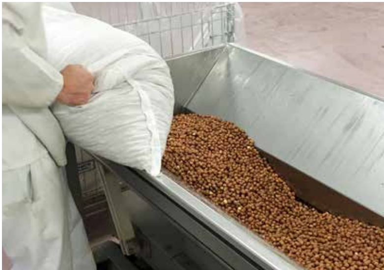
Az esetek többségében a nyersanyagok a származási helyről egyenesen az üzembe kerülnek.